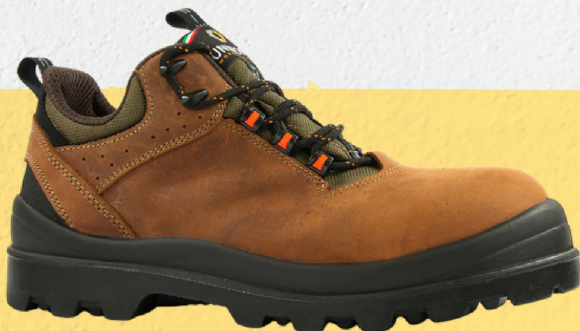
ATENE 58.076.70 S3 SRC

Gornji deo cipele: prirodna koža Unutrašnjost: HK3 postava Zaštitna kapa: 200J nemetalna Unicomp® Međudon: nemetalni Armateak 0+ Unutrašnji uložak: Unisoft® Đon: SOLAGRIP PU 2D Veličine: 38 - 48 Pakovanje: 10/1