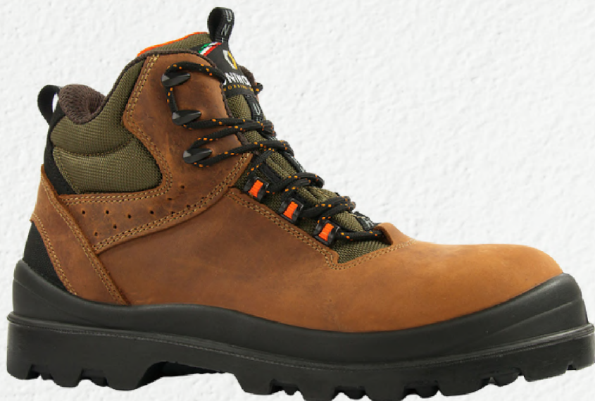
ARAL 58.075.70 S3 SRC

Gornji deo cipele: prirodna koža Unutrašnjost: HK3 postava Zaštitna kapa: 200J nemetalna Unicomp® Međudon: nemetalni Armateak 0+ Unutrašnji uložak: Unisoft® Đon: SOLAGRIP PU 2D Veličine: 38 - 48 Pakovanje: 10/1